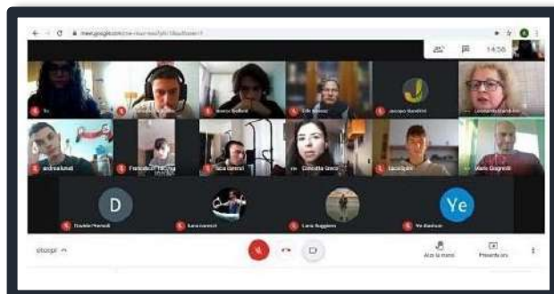
-Gli studenti in riunione con la referente-